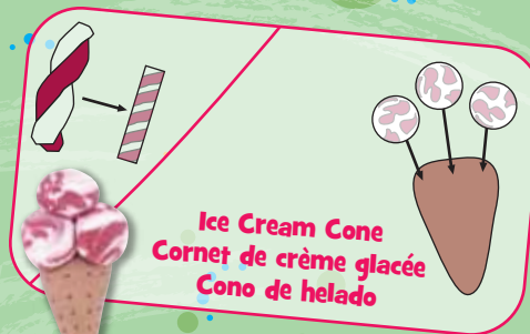
Ice Cream Cone Cornet de crème glacée Cono de helado