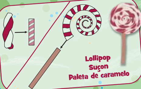
Lollipop Suçon Paleta de caramelo

Project instructions: Make all pieces as shown and assemble before baking. Instruccions du projet : Fabriquer les pièces tel qu'indiqué et les assembler avant de les faire cuire. Instrucciones del proyecto: Moldear todas las piezas como se muestra y ensamblar antes de hornear.